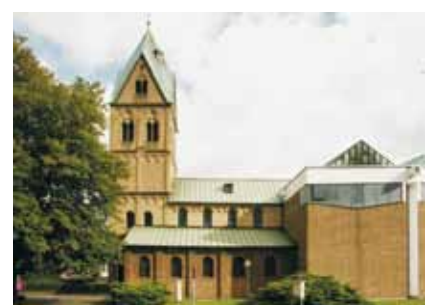
Links: Saalkirche um 1000 Mitte: Basilika bis 1885 Rechts: Altteil der Kirche heute