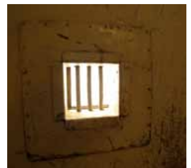
Rechts: Sichtöffnung in einer Zellentür