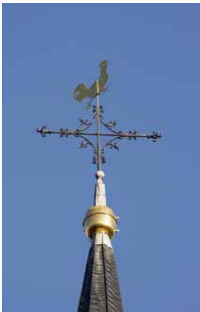
Turmhahn der Brauweiler Abteikirche (Beitrag von Peter Schreiner)