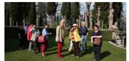
Geschichtsverein auf Reisen

Jahr noch kostengünstiger anbieten. Die Zusammenarbeit mit zwei neuen Reiseunternehmen macht es möglich. Vielleicht ist auch für Sie etwas dabei.