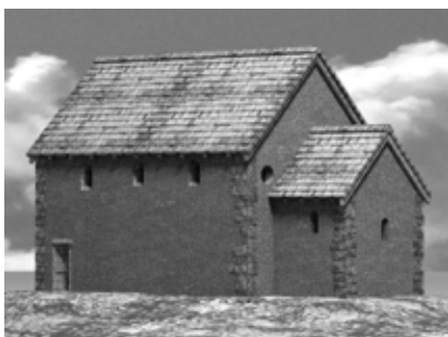
Baugeschichtliche Entwicklung der Pfarrkirche St. Kosmas und Damian in Pulheim (Beitrag von Josef Wißkirchen)

Das Herzstück der Arbeit des Vereins für Geschichte e. V. sind die jährlich erscheinenden „Pulheimer Beiträge zur Geschichte“. Unseren Mitgliedern werden sie als Entgelt für ihren jährlichen Mitgliedsbeitrag von 15,00 € kostenlos zugestellt. Im Buchhandel sind sie für 15,00 € erhältlich. Einige Abbildungen aus dem diesjährigen Jahrbuch sollen die Bandbreite der Themen verdeutlichen, die von der Jungsteinzeit bis in die Gegenwart reichen. Der diesjährige Band der „Pulheimer Beiträge“ ist der 33. in einer langen Reihe. Vereinsmitglieder der ersten Stunde sind stolz und glücklich, sie komplett zu besitzen.