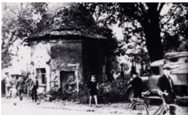
Kriegszerstörte Barbarakapelle in Pulheim

Der Vortrag will die Lebensumstände und Stimmungslagen der einheimischen Bevölkerung und das Schicksal der Evakuierten aus Pulheim, der Flüchtlinge aus dem Aachen-Jülicher Raum und der Kriegsgefangenen deutlich machen.